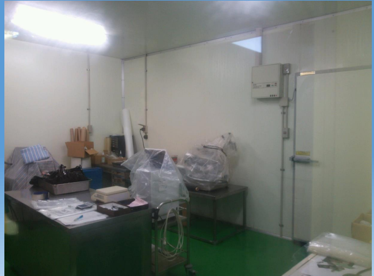
扉の先はシカの冷蔵施設