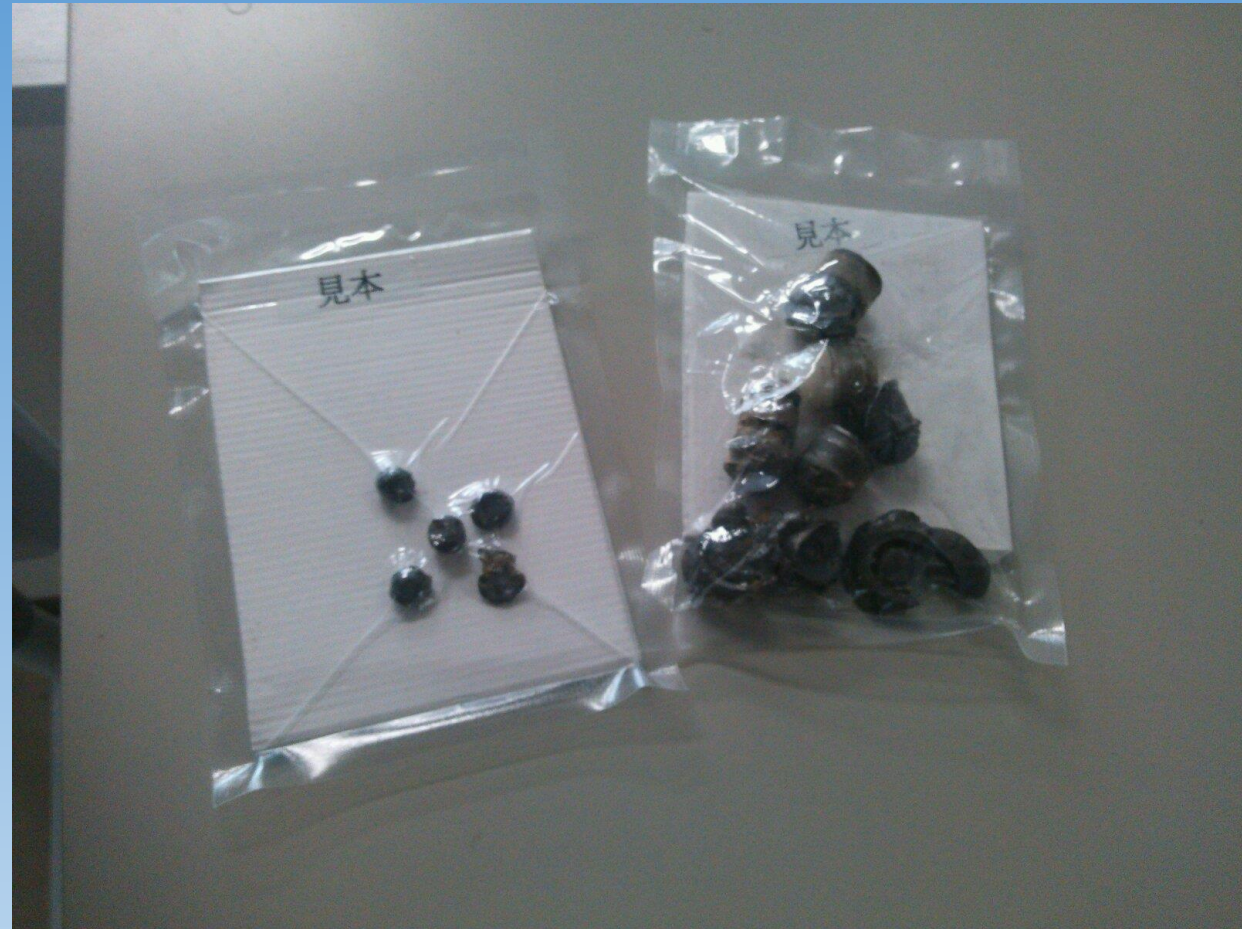
獲物を仕留めた銃弾 綺麗に命中した 体内で散った