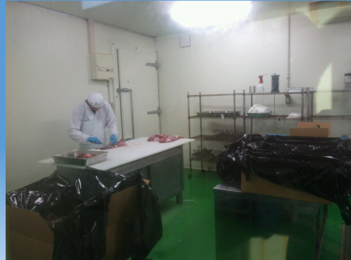
加工中のシカの肉