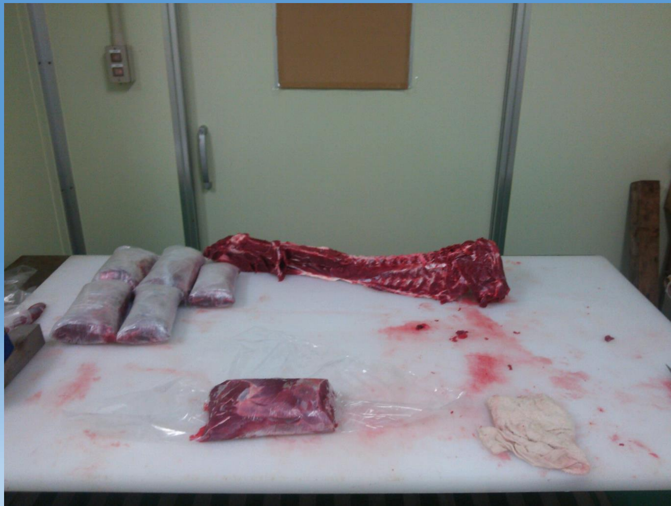
加工されたばかりのイノシシ肉