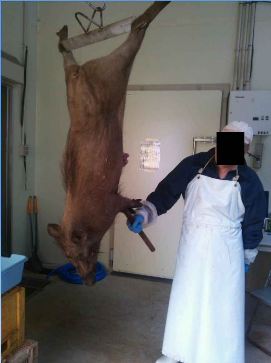
朝捕獲されたばかりのイノシシ