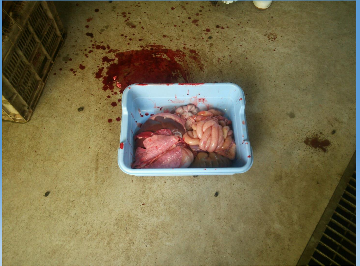
取り出された臓器