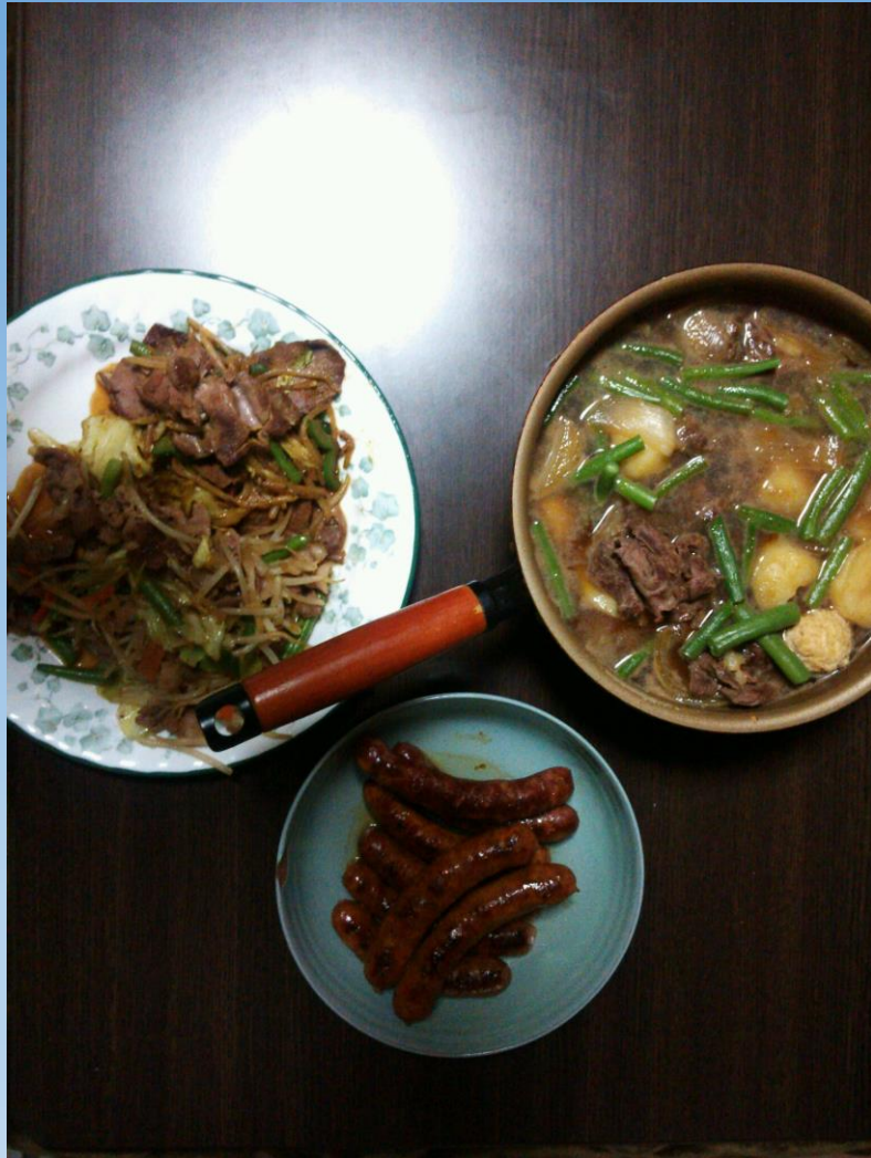
野菜炒め(シカ、イノシシ)、肉じゃが、ソーセージ

普通の家庭で食べることを念頭に置いているので、ジビエに合う料理を考案せず、肉が定番の家庭料理に合うかどうかを試してみることにした。