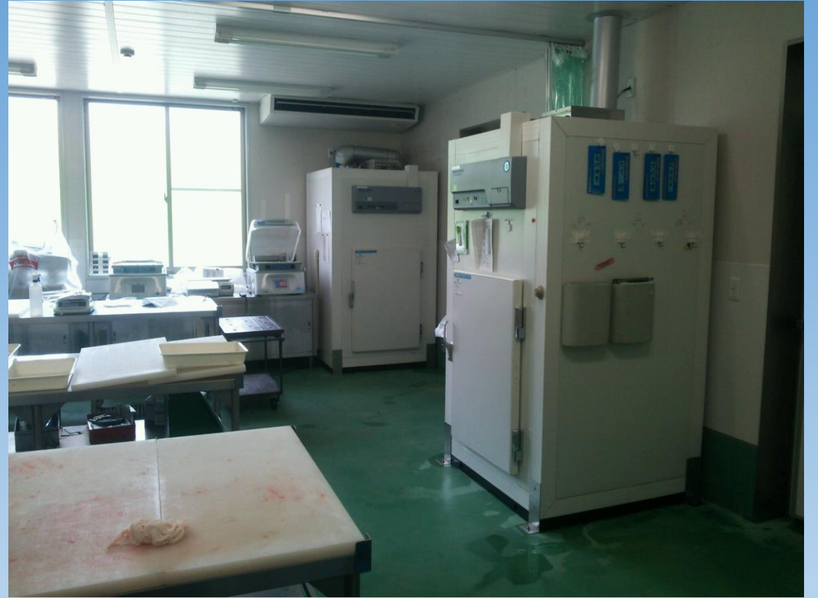
手前がシカ用 奥がイノシシ用