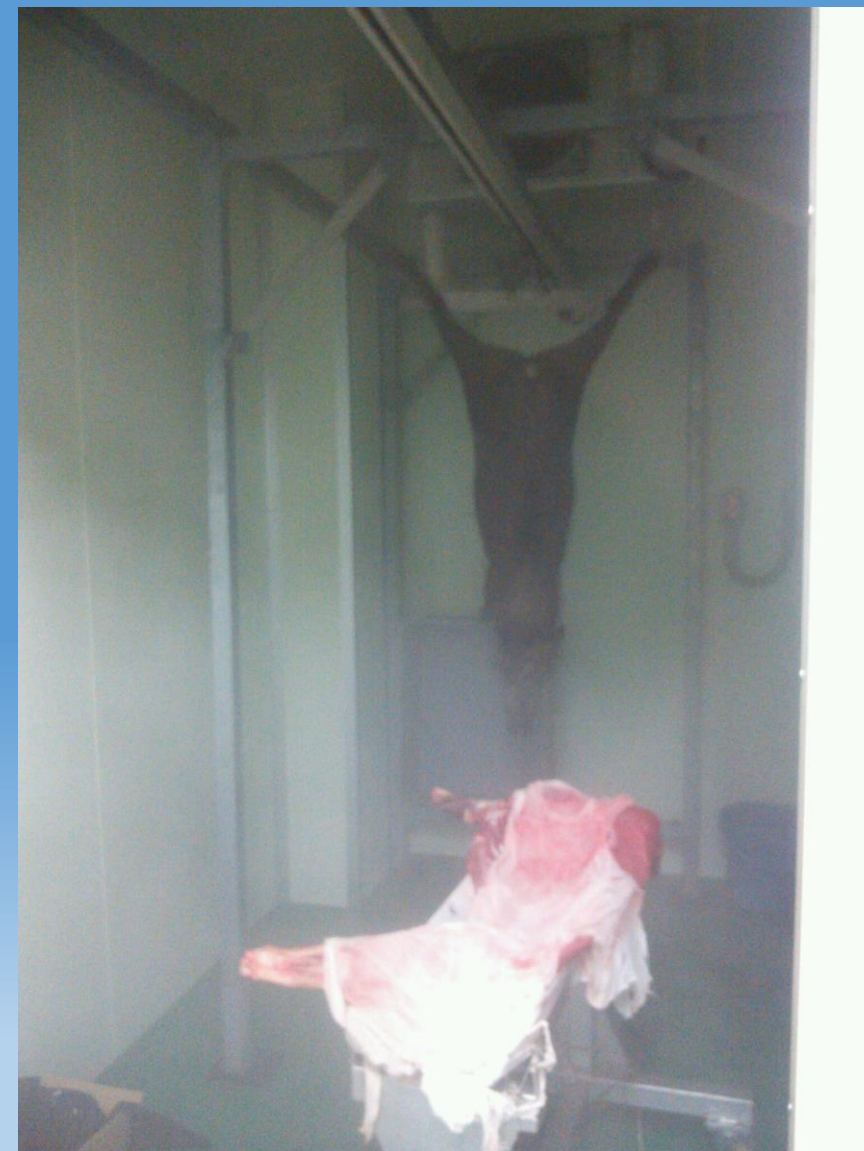
先ほどのイノシシ