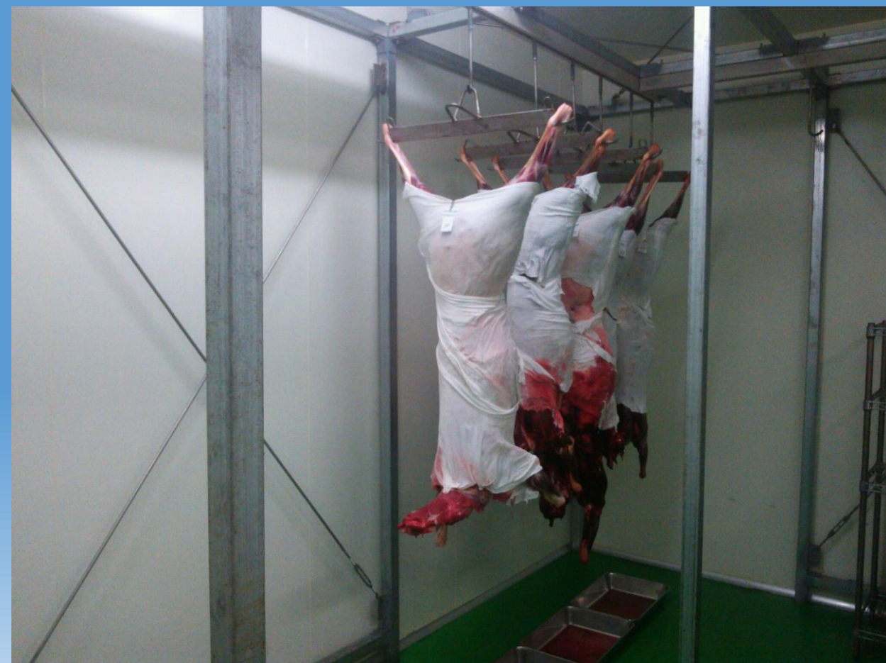
熟成中のシカ 血抜きも