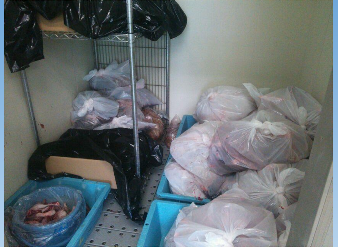
ペットフード用と廃棄